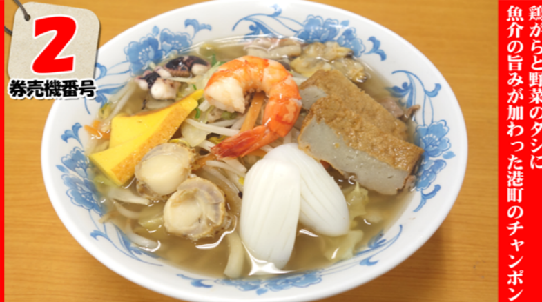
やわたはまチャンポン Yawafahama chanpon noodles ¥650