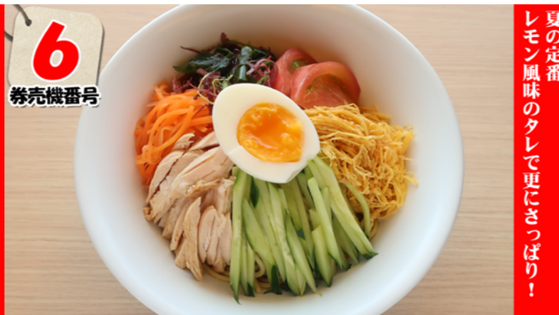
冷やし肉盛うどん Chilled meat udon ¥680