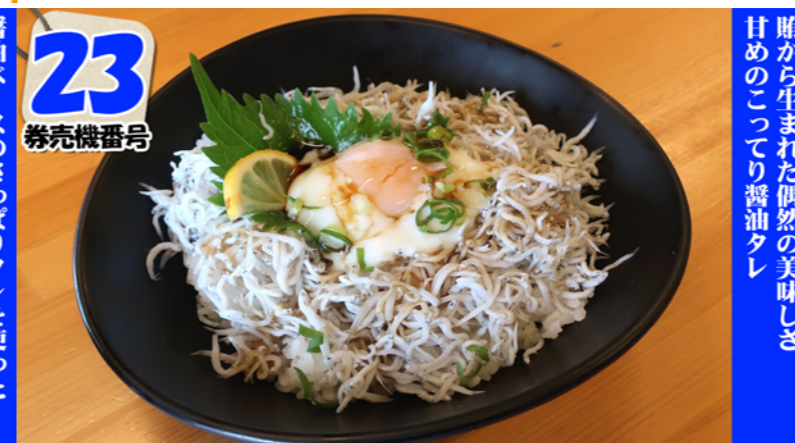
温玉しらす丼 (味噌汁付) Shirasu & hot spring egg rice bowl (and miso soup) ¥710