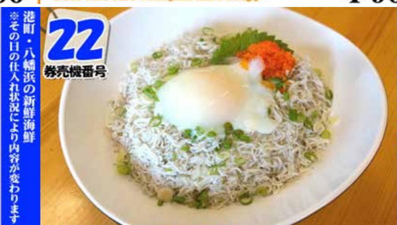
海鮮丼 (味噌汁別売) Seafood rice bowl ¥880