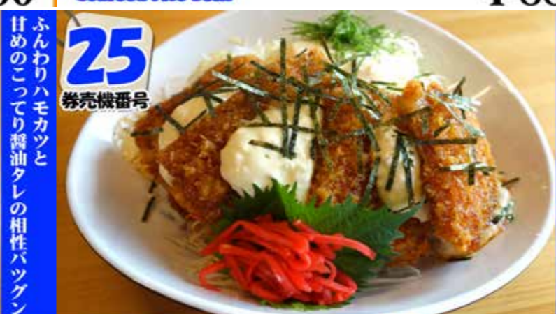
ハモカツ丼 (味噌汁別売) Pike coger cufflet rice bowl ¥700