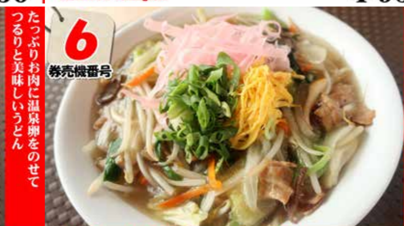
肉うどん Meat udon ¥650