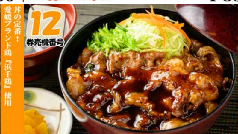
浜千鶏親子丼 (味噌汁付) Chicken and egg rice bowl (and miso soup) ¥700